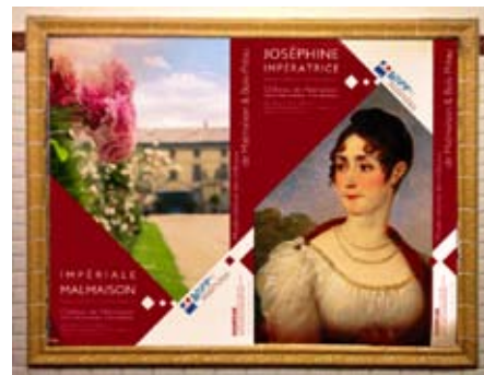
TELECHARGEZ LE PROGRAMME CULTUREL SEPTEMBRE 2014 - FEVRIER 2015